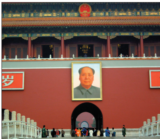
Indgangen til Den forbudte By

mur. Både her og i parkene kommer man nær den vanlige kineserens hverdag. Inklusiv frokost, lunsj og middag.